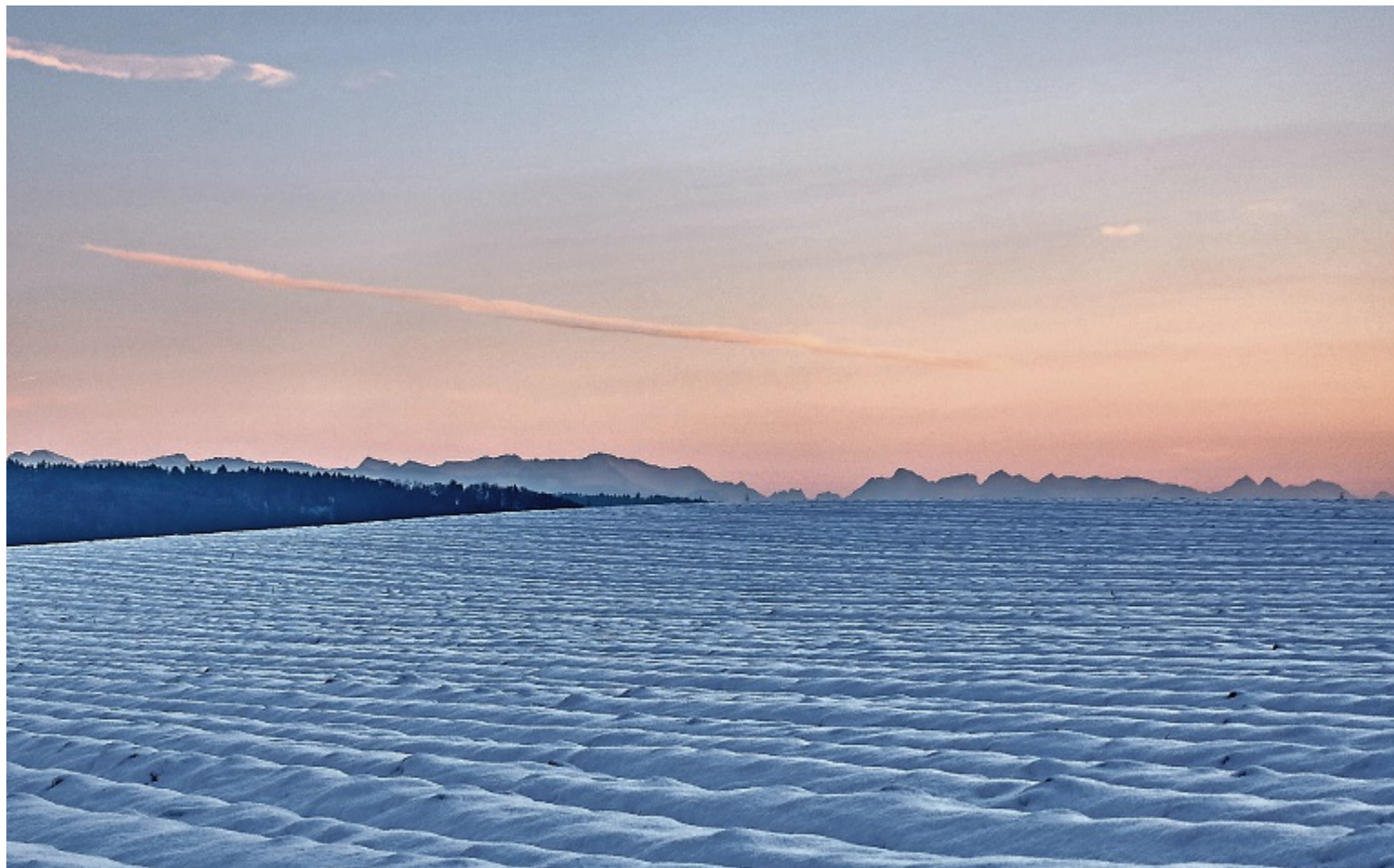
Dieses Bild ist auf dem Weg vom Winterhäli-Wald Richtung Niederbottigen entstanden. Um diese Perspektive zu erhalten, musste ich die Kamera fast auf die Ebene des schneebedeckten Feldes bringen.