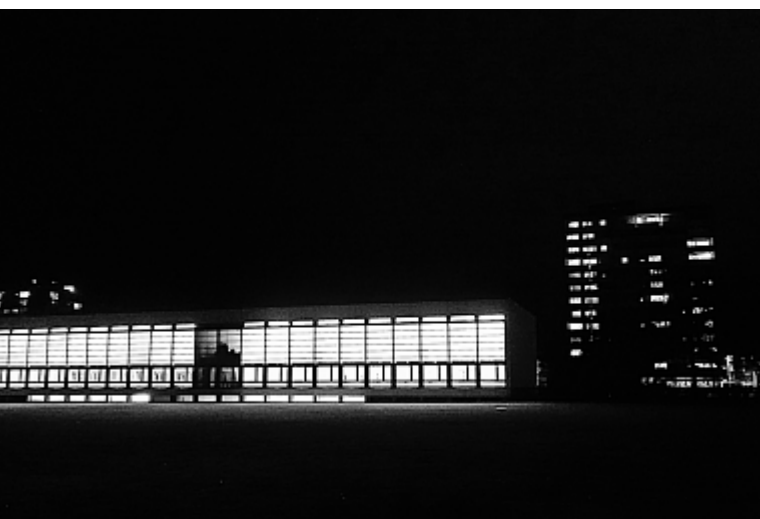
Bild zeigt die Turnhallen und Hochhäuser im Schwabgut-Quartier. Das Bild Stativ entstanden.