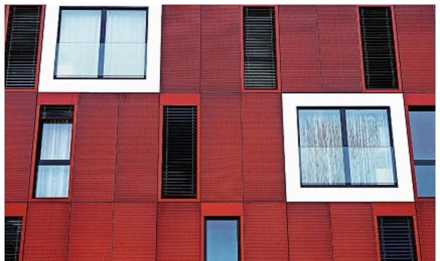
Living in the West - Fassade eines Wohnhauses in Bern Brünnen (beim Westside Shopping-Center).