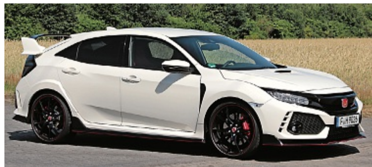
Auf Sport getrimmt: Der Honda Civic R bietet Platz für fünf. RHo

Noch nie hat es einen sportlichen Kompaktwagen gegeben, bei dem serienmässig 320 PS aus einem 2-Liter-Vierzylinder generiert werden. Diese wirken auf die Vorderräder, welche die Kraft so souverän auf die Strasse bringen, dass in 5,7 Sekunden die 100 km/h-Marke erreicht wird (maximal bis 272 km/h). Das mittlere der drei Auspuffrohre moduliert den Motor-Sound. Der Civic Type R wird ab Fr. 37 300.– angeboten, die GT-Version fährt für Fr. 41 300.– auf die (Renn-)Strecke. RHo