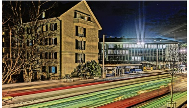
Tram Nr. 7 in der Nähe der Haltestelle Post.