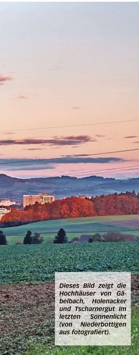
Dieses Bild zeigt die Hochhäuser von Gäbelbach, Holenacker und Tscharnergut im letzten Sonnenlicht (von Niederbottigen aus fotografiert).

Bümpliz. Dorthin kehre ich immer wieder zurück. Im Westen gibt es einfach unglaublich schöne Abendlicht-Stimmungen.