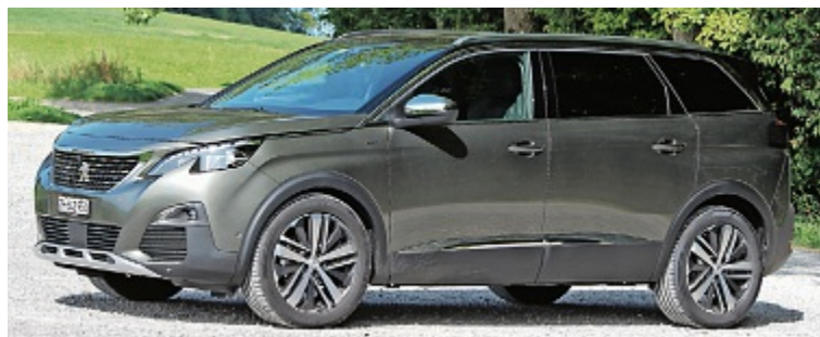
Rennfeeling: Im offenen Abarth 124 werden alle Sinne bedient und gefordert.

Mit seiner Länge von 4,65 Meter ist der Peugeot 5008 ein grosses Auto, das zudem durch die gute Raumnutzung gar zum Platzriesen mautsert. Seine kubischen Formen sind vor allem aussen präsent. Sie beginnen bei der steil ansteigenden Front führen über die gradlinige, leicht ansteigende Seite und enden im Steilheck. Den SUV-Charakter unterstreichen der vorne angedeutete Unterfahrschutz, die mit Kunststoff eingefassten Radausschnitte sowie die hohe Bodenfreiheit. Innen sorgen bis zu sieben Sitzgelegenheiten dafür, dass die ganze Familie mitreist. Der Kofferraum